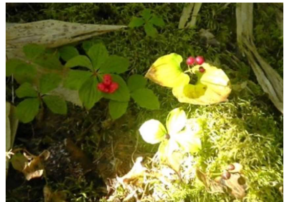
コゼンタチバナと マイズルソウ