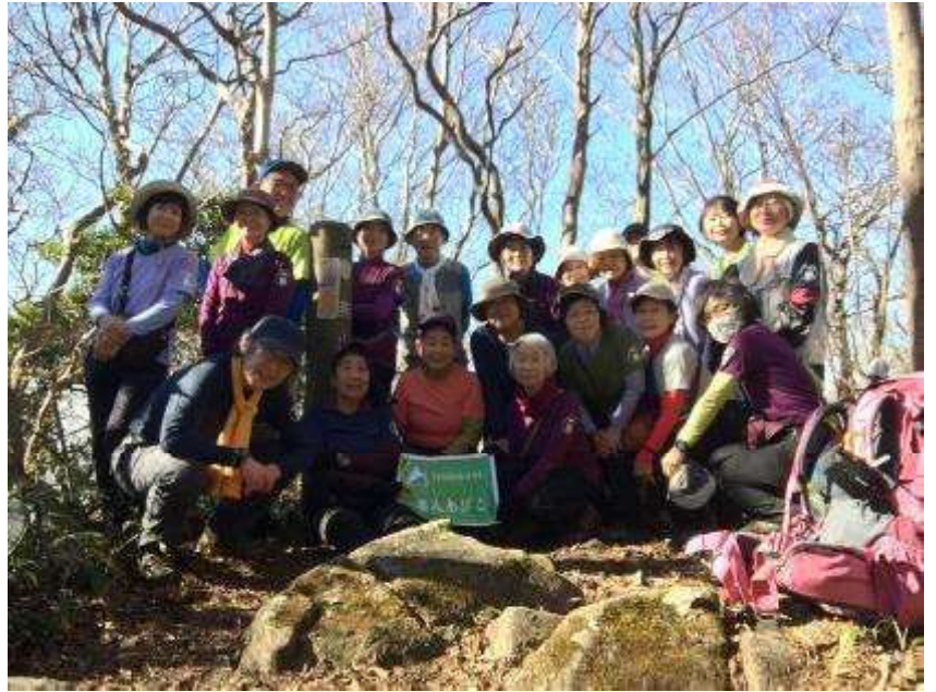
燕山山頂に 20 名