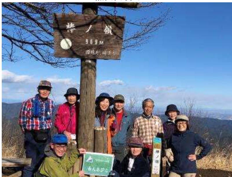
棒ノ折山（棒ノ嶺）山頂で