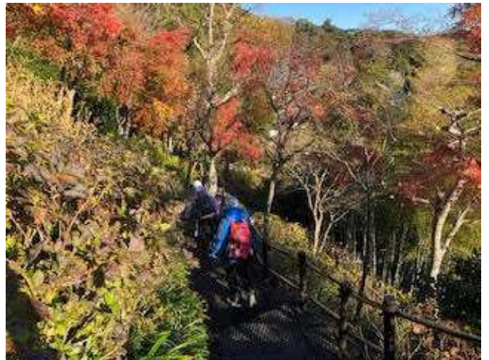
紅葉のハイキング