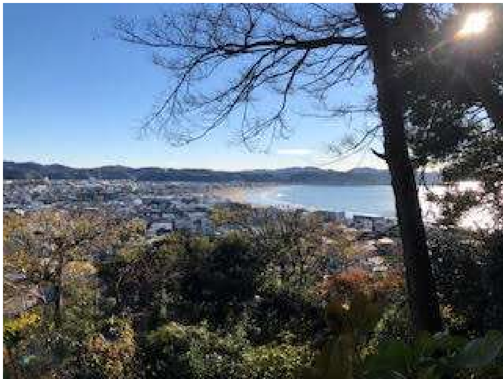
ハイキングコースから