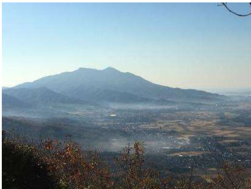
裏筑波連山からの筑波山