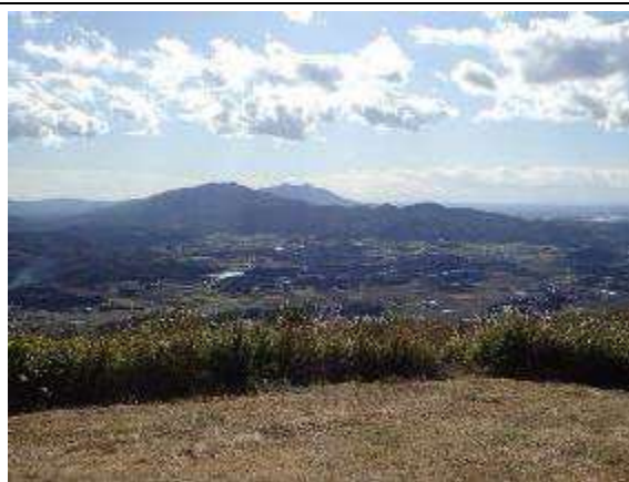
パラグライダー離陸場からの展望