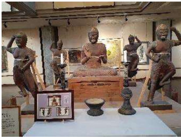
木造五大力菩薩像