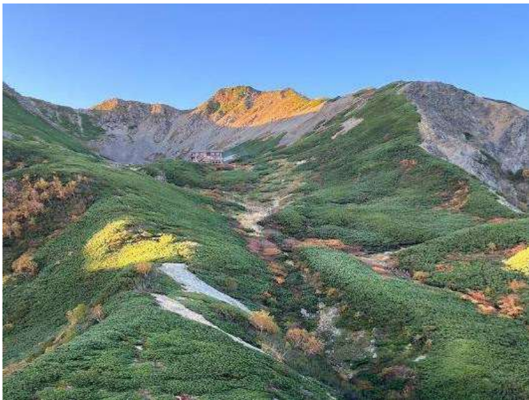
雄大な藪沢カール