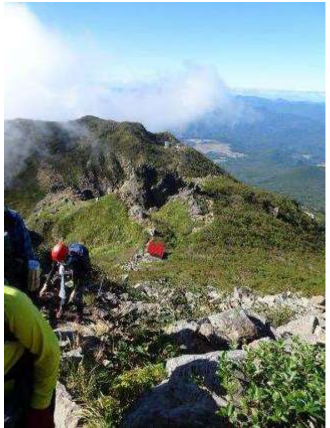
頂上手前から鳥海山(鳳鳴避難小屋)