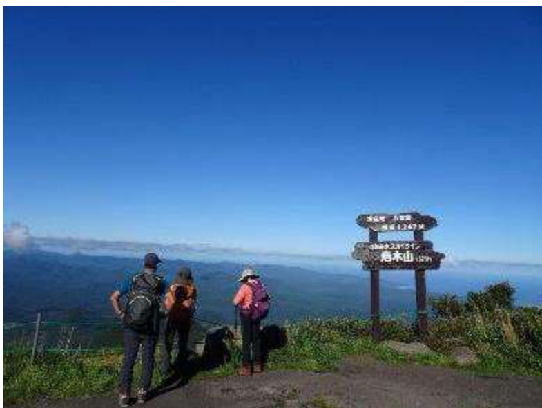
8合目スカイラインからの日本海