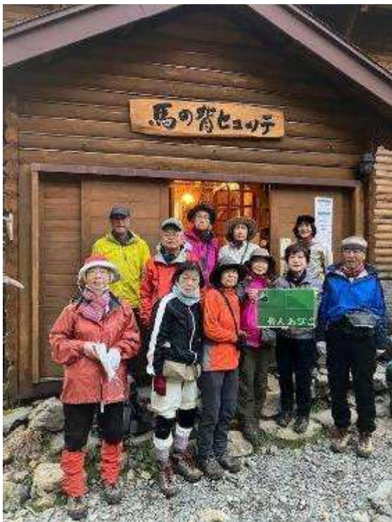
女将さんお世話になりました