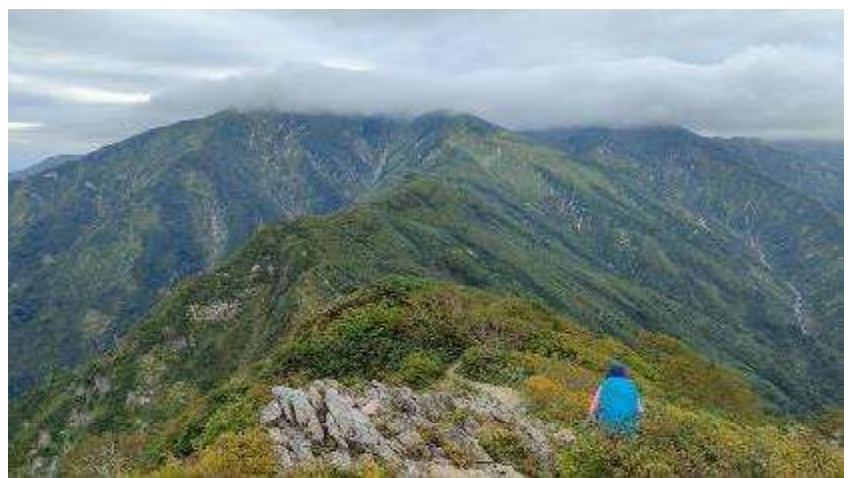
大朝日岳は雲の中