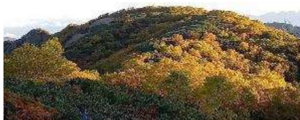
なだらかな山に紅葉