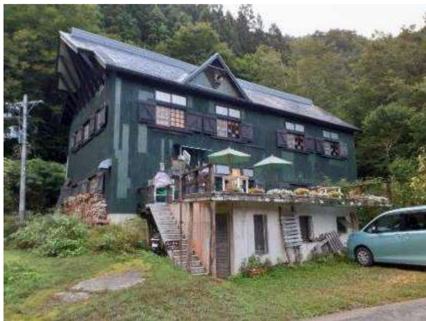
朝日鉱泉ナチュラルリストの家