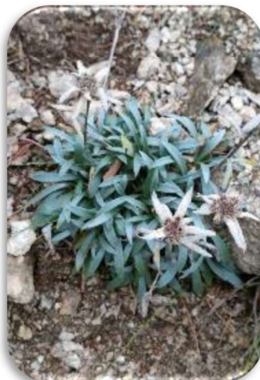
「エーデルワイスの仲間種」