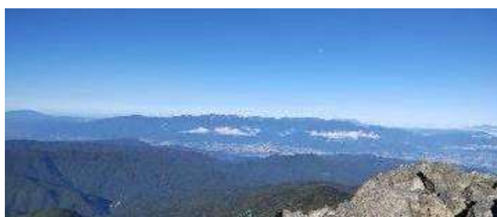
遠くは北アルプス～