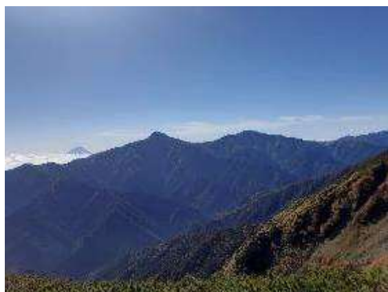
日本の山、ワン・ツー・スリー