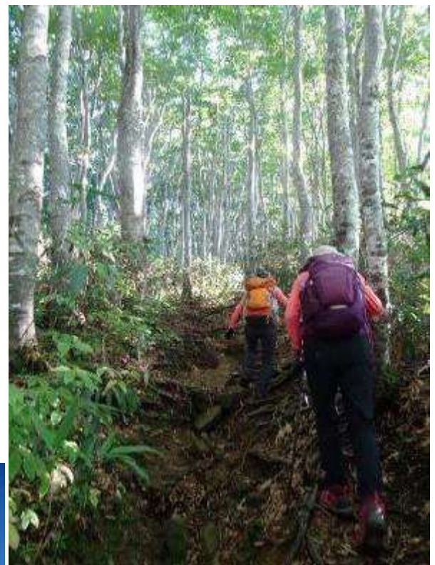
嶽温泉ルートオブナ林