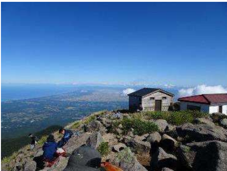
山頂避難小屋その左は津軽半島の海岸