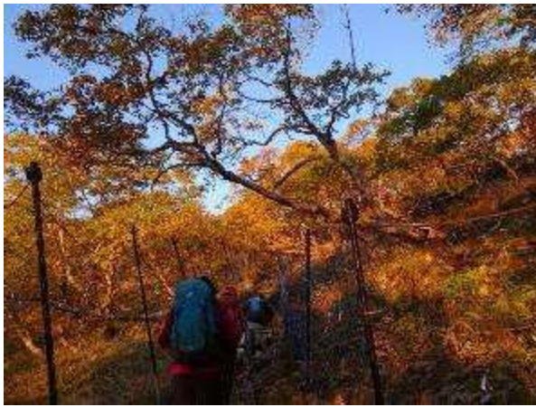
朝陽が当たる鹿の防護