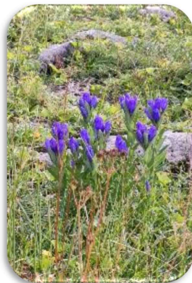
エゾオヤマリンドウ