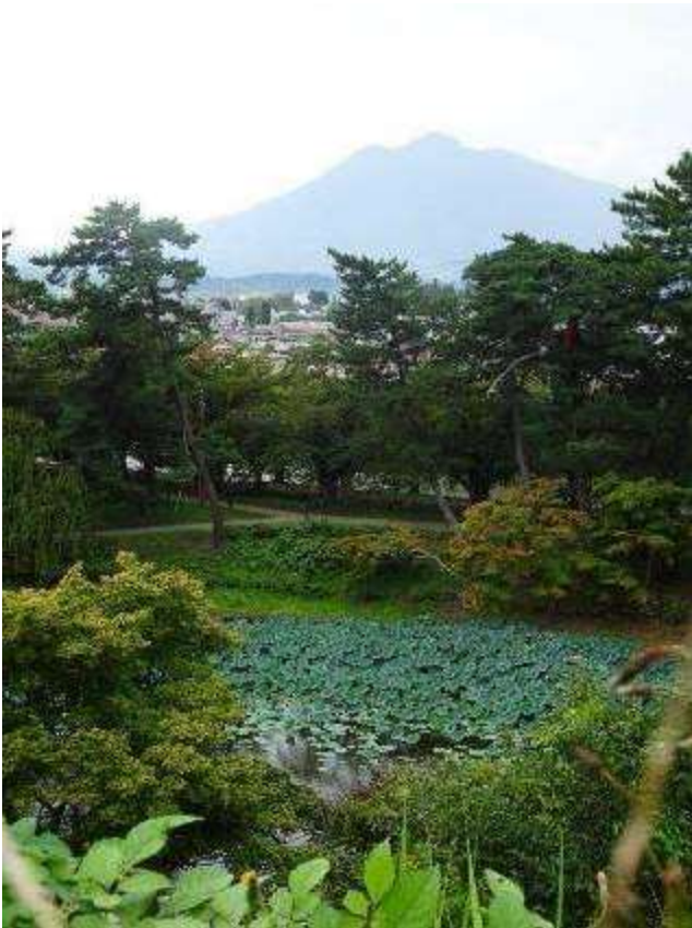
弘前城から見た岩木山