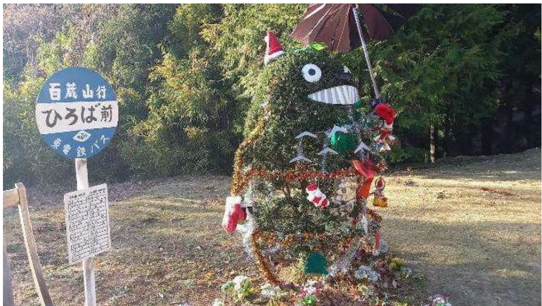
名物(?)トトロのバス停(下半身が透けている)