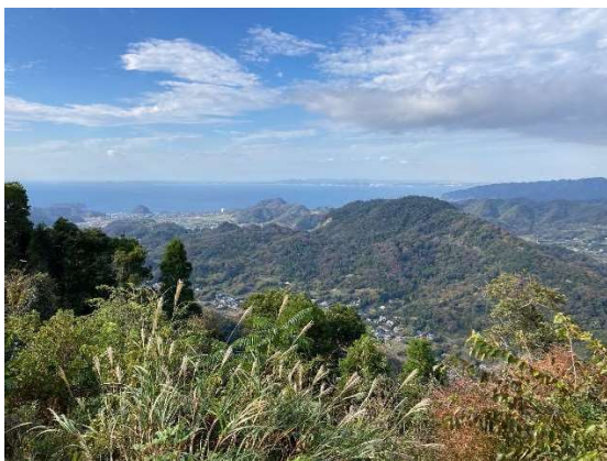
富山山頂からの風景