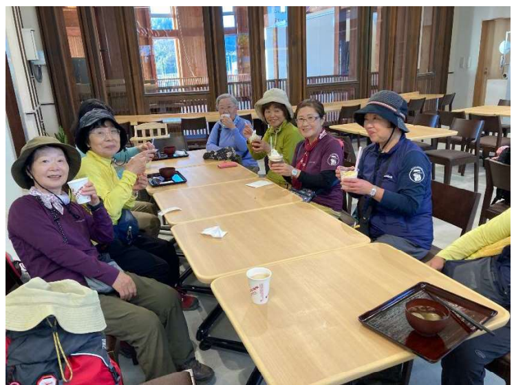
道の駅富楽里とみやまでの一時