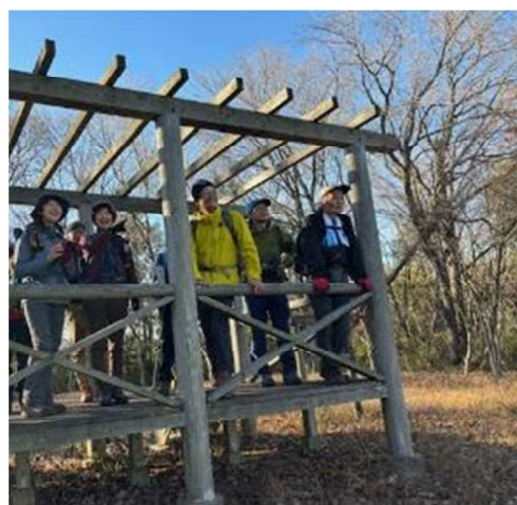
展望の丘から岩間の町を望む