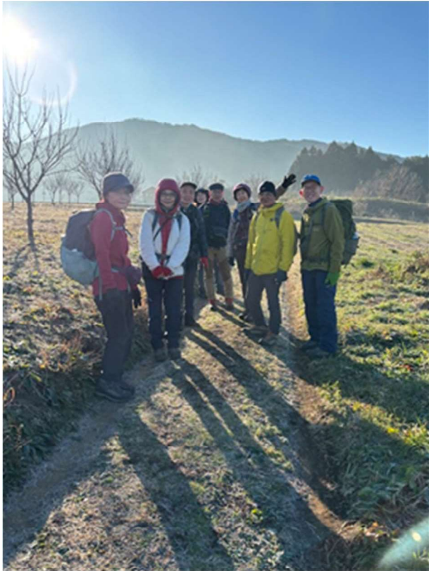
1年で2番目？に影の長い朝 草も地面も白い霧で覆われていた