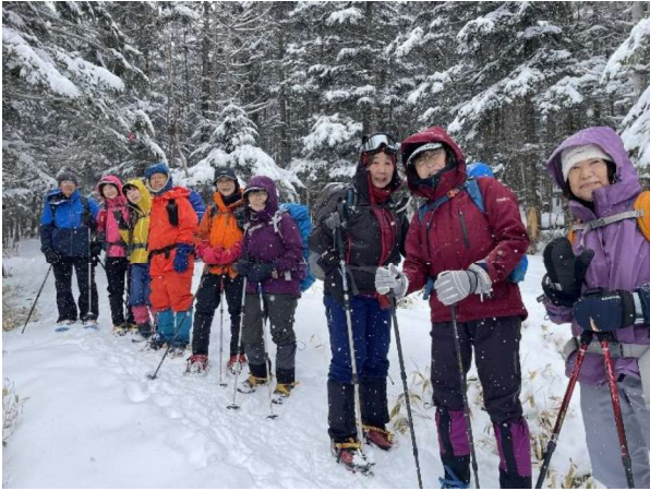
一日目ずっと雪だった