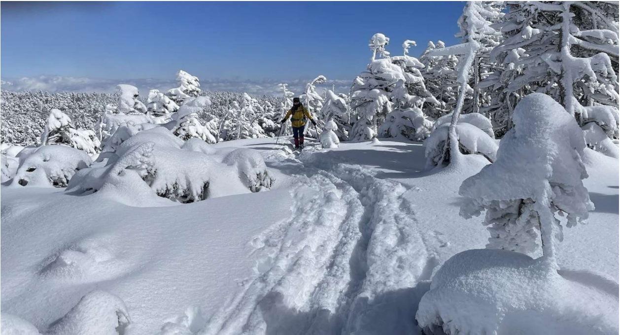
A班 新雪を歩いてトレースができる