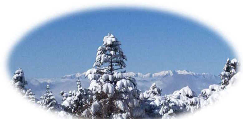
新人さん、高見石の上でバンザイ ↑アルプス眺望